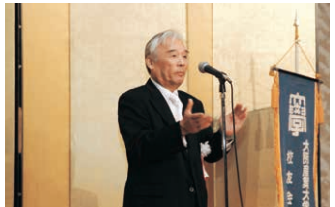
お礼の言葉（梅原副会長）

「35年ぶりに来阪したが、街並みが大きく変わっていることにショックを受けた。産大の校友会は他大学と比べても活気があると思う。」というご意見の反面、「一般会員には支部活動があまり見えてこない。支部総会を永年開催して