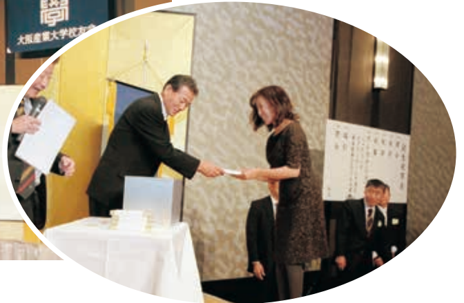
お楽しみ福引抽選会