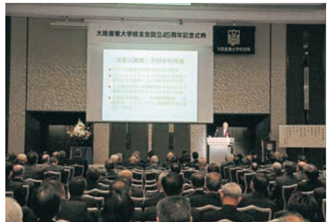
金澤前学長による記念講演