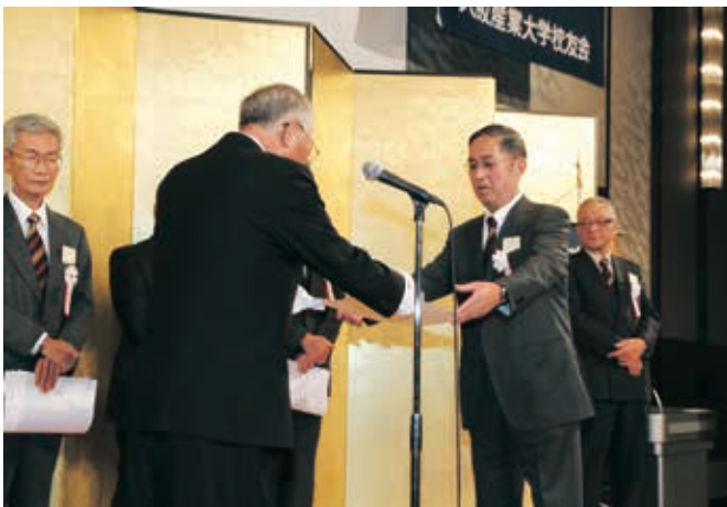
感謝状授与（美内相談役）