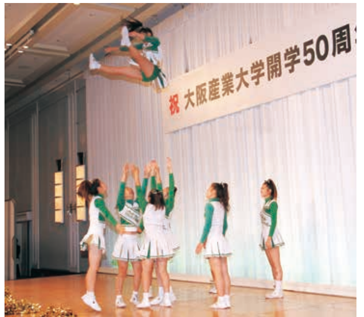
チアリーディング