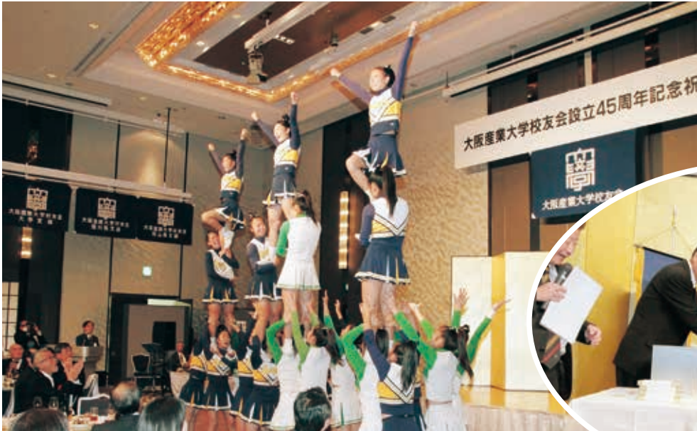
大学・附属高校合同チアリーディングチームの演舞