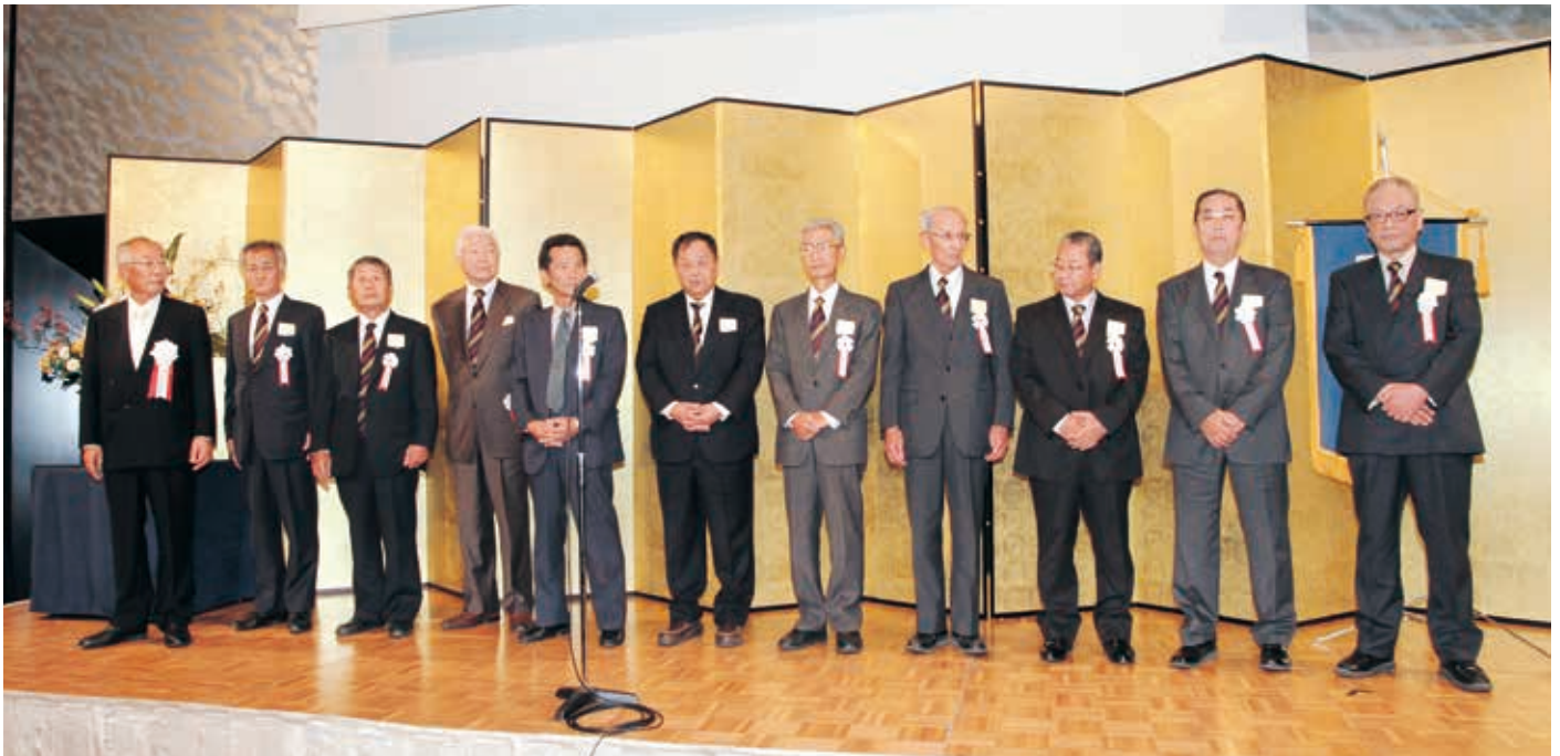
表彰されたみなさん