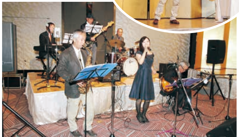
軽音楽部 OB による演奏