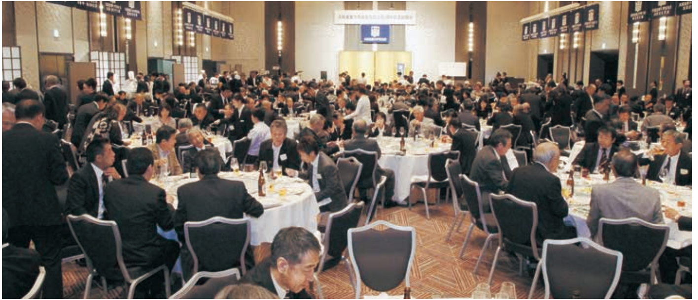
祝賀会・会場風景