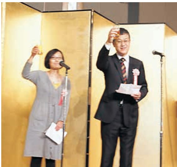
乾杯（天津理工大学鄭副学長）