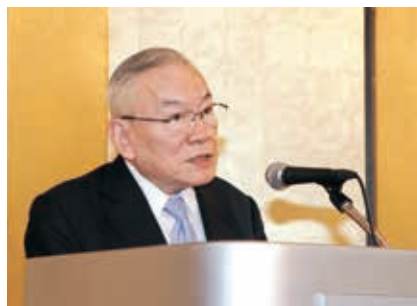
祝辞 (土肥前理事長)